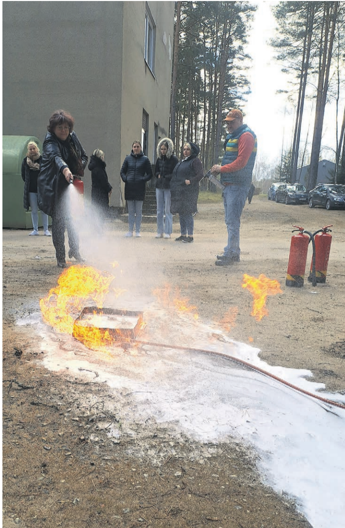
Õpetajad tegid läbi tulekustuti kasutamise harjutuse.