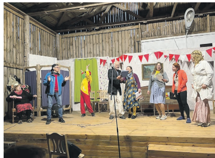
OUT tiatri pruuv.

„Ku Pipi suurõst sai, läts mehele kindlahe Tommylõ, om