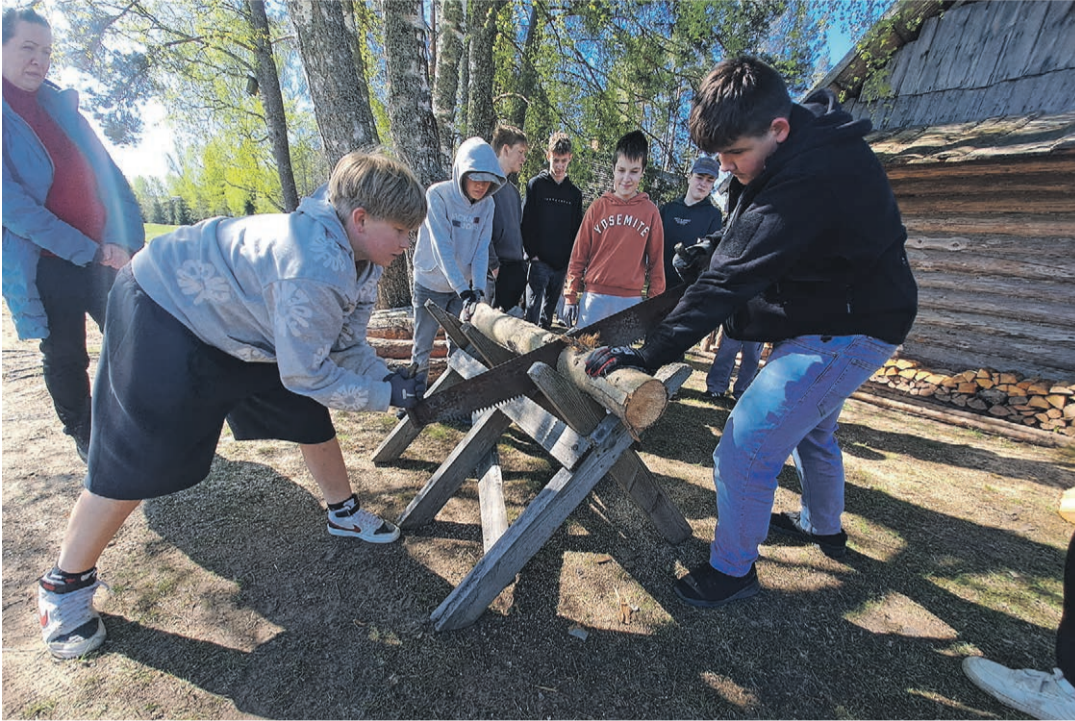
Verska talomusium oppas vannu töid.

Siih tull appi Eesti Muusiumidõ Ühing, kiä' otsõ lahenduisi ja võtt kuuhtüühü viis muusiumi, näide siäh ka' Setomaa Muusiumi'. Kuuhtüü tsiht om, õt koolilatsõ' saasi' liki muusiumihariduslikõlõ programmõlõ, a osavõtõmisõ raha-