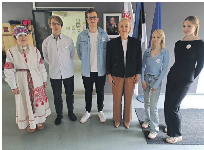
Haridus- ja teadusminister Kristina Kallas kohtus 15. mail Värskas koolimajas ka õpilastega, et küsida nende käekäigu ja tulevikuplaneerimise kohta.

Absoluutselt. Absoluutselt tuleb lapsele kasuks. See on kindlasti keerulisem, kui ta õpiks kõik eesti keeles. Alguks on keerulisem, aga teadus on keerulisem, aga teadus on näidanud ka seda, et keele sellisel moel äraõppimine võtab mõnel lapsel umbes aasta ja teisel lapsel neli aastat, sest lapsed on erinevad, aga pärast on lapsel tegelikult keel selge. Ta on võimeline selles keeles