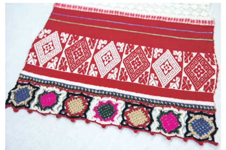
Linik „Imäkõnõ ilolinõ“