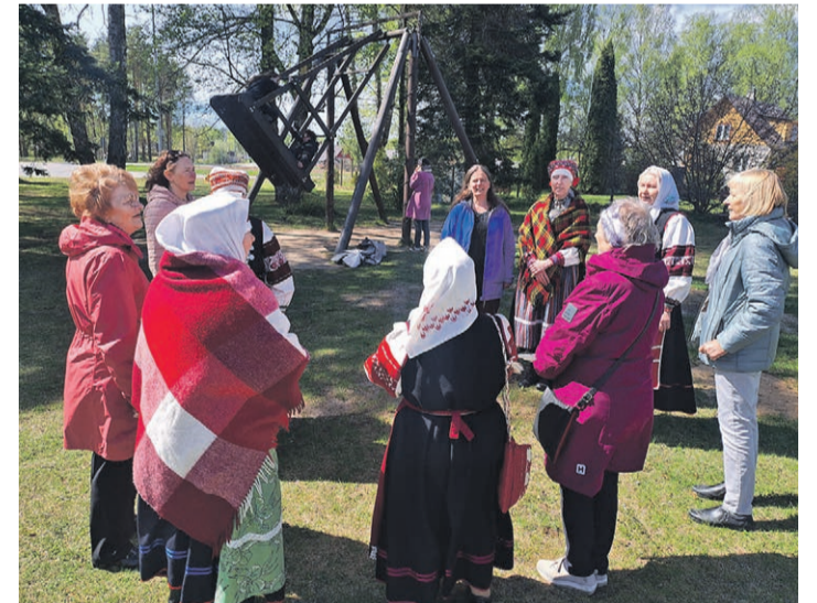
Värskas rahvas tähistas kolmapäeval, 6. mail vana kalendri jüripäeva, mis on Värskas kiriku ja selle kandi suurim püha – Püha Georgius ehk Püha Jüri on Värskas kiriku nimipühak. Jüripäeva tähistamise juurde kuulub jumalateenistus Värskas kirikus ja kalmistul peetav mälestussõmmaeg. Hiljem tuldi kokku kirmaseplatsile, et tantsida, leelotada ja huigata kiigel.