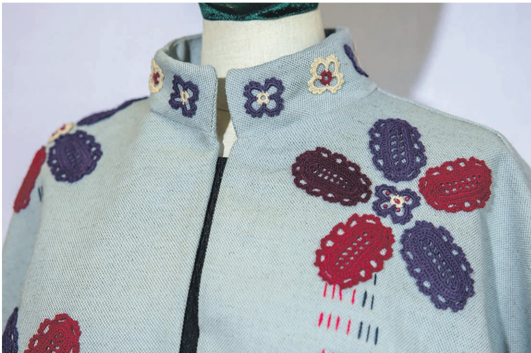
Jakk „Looklõvalt raal“