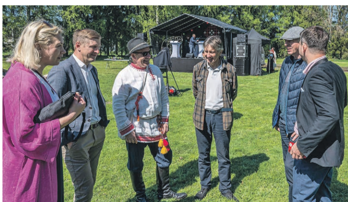
Maheleppõ allkirästämisõ huuh.