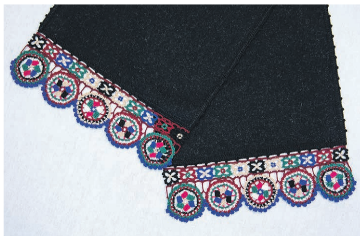
Seto päälilige pitsiga ilostõt sall