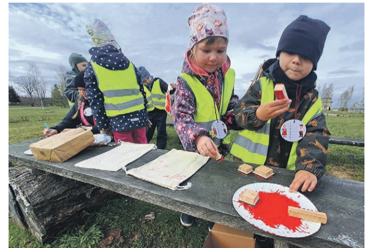
Kangast kotile külanimede löömine templiga pakkus lastele tõelist huvi.