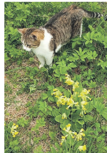
Sarvõ Õiõ pilt