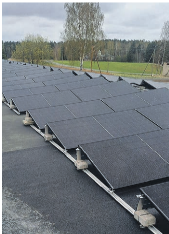
Päikesepaneelid väärdamiskeskuse katusel.

ning kaablid ühendatud,“ märkis Kikas. „Väikeste sammudega minnes, vigadest õppides, jõuame suuremate tulemusteni. Lõppude lõpuks, kes meid siin, Eestimaa ja Euroopa servas, ikka aitab, kui mitte me ise?“