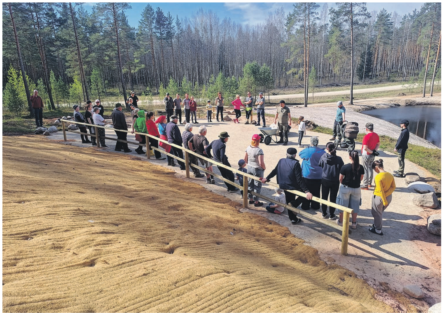
Talgulisõ' vallutasõ' Säitsmemäke.