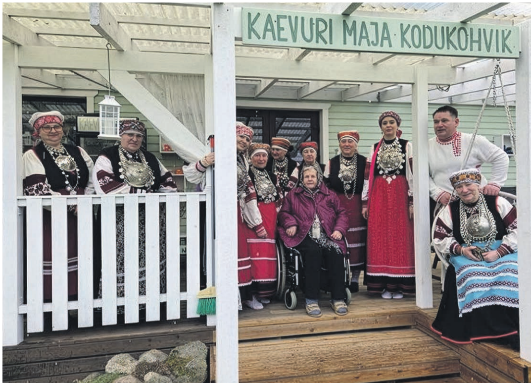
Sõsarõ naase' üteh pererahvaga Kaevuri maja kodukohvigu repi pääl.