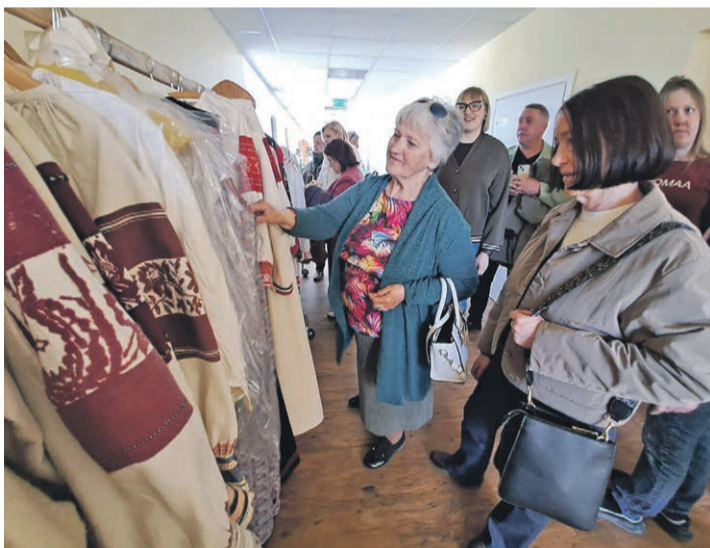
Külalised Smiltene tegid Obinitsa külakeskuses tutvust seal valmistatavate seto rõivastega.